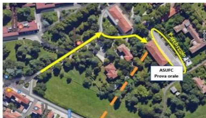
Planimetria palazzina ASUFC

I candidati verranno convocati al colloquio in diverse fasce d'orario al fine di evitare la sovrapposizione di presenze. I requisiti di accesso alla sede della prova orale sono gli stessi riportati al paragrafo 6.