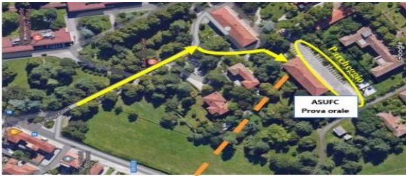
Planimetria palazzina ASUFC