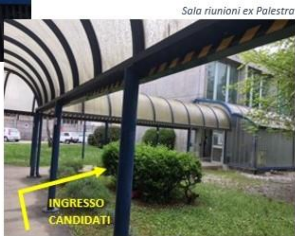
Sala riunioni ex Palestra