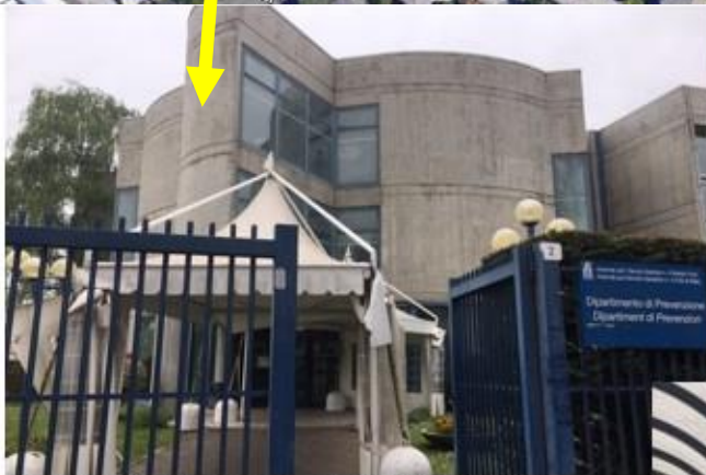
Dipartimento di Prevenzione, Via Chiusaforten.2 Udine