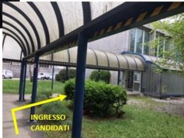
Sala riunioni ex Palestra